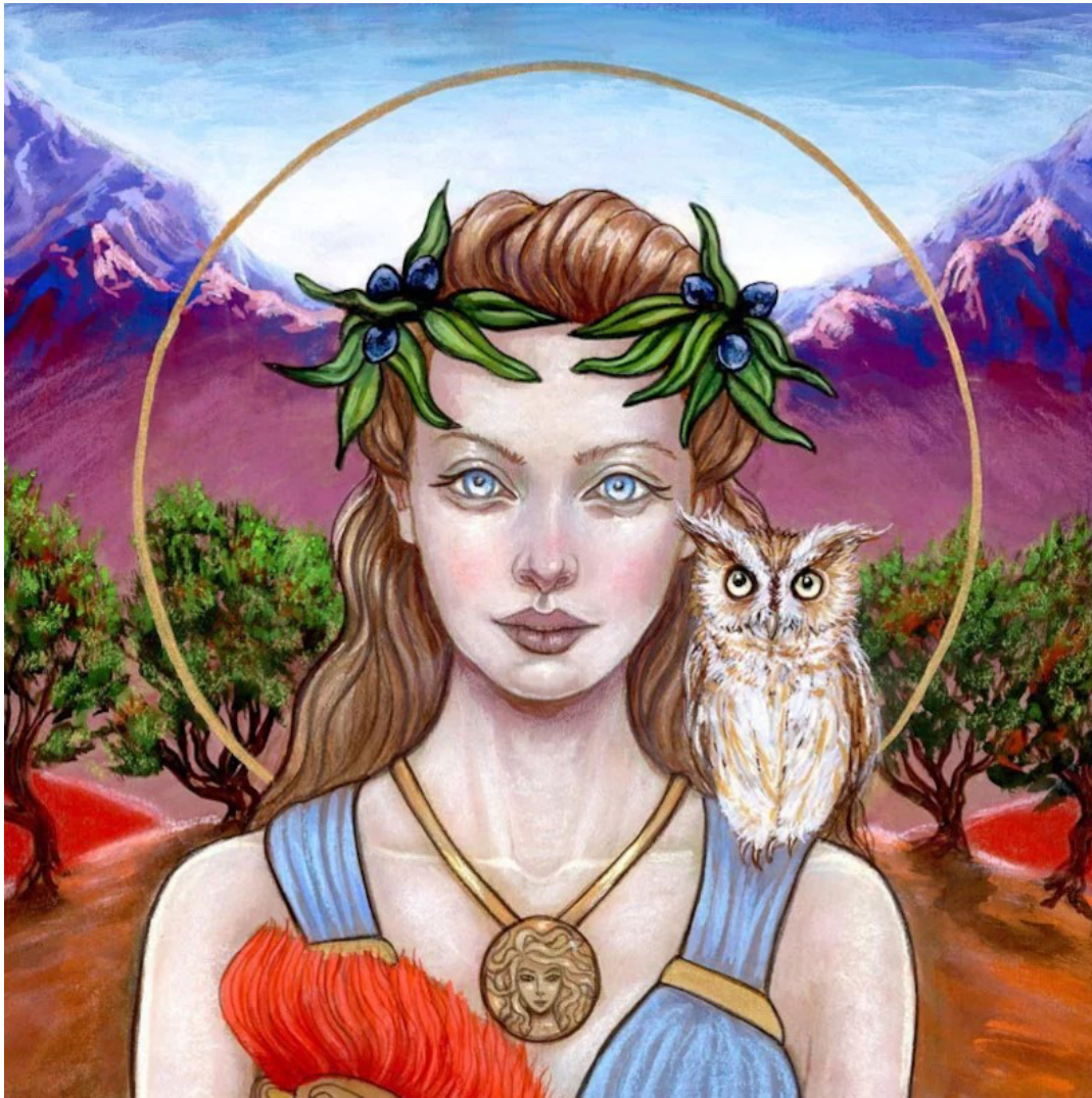
MoonSpiralart – copyright beachten! The fine Art of Tammy Wampler

"Athene ist nicht nur eine Kriegsgöttin. Sie ist eine komplexe und polyvalente Göttin mit vielen anderen Eigenschaften - als Göttin der Heilung, der Weisheit, des Schutzes und der Selbstverteidigung, des Handwerks und der Kultur, des Olivenbaums - die für all diejenigen, die von Traumata heilen, eine große Bedeutung haben kann. "