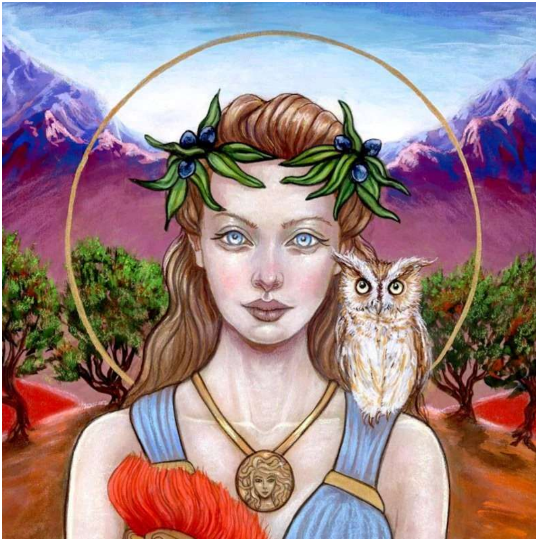
MoonSpiralart – copyright beachten! The fine Art of Tammy Wampler

"Athene ist nicht nur eine Kriegsgöttin. Sie ist eine komplexe und polyvalente Göttin mit vielen anderen Eigenschaften - als Göttin der Heilung, der Weisheit, des Schutzes und der Selbstverteidigung, des Handwerks und der Kultur, des Olivenbaums - die für all diejenigen, die von Traumata heilen, eine große Bedeutung haben kann. "